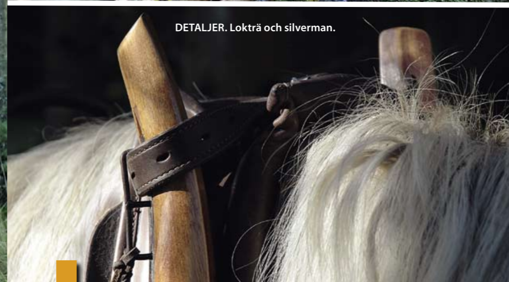
DETALJER. Lokträ och silverman.