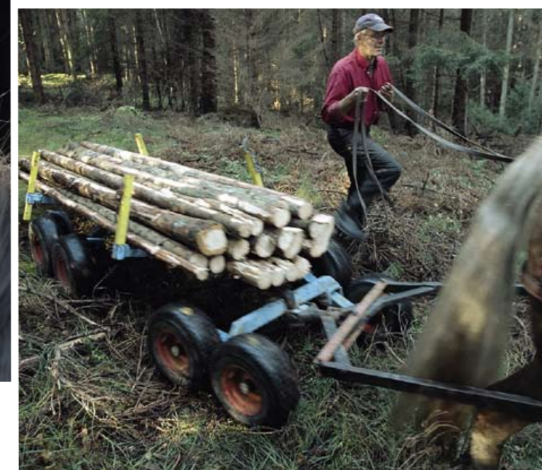
HJÄLPMEDEL 2. Åttahjulingen klättrar lätt över ris och pinnar medan människan får ta ordentliga kliv.