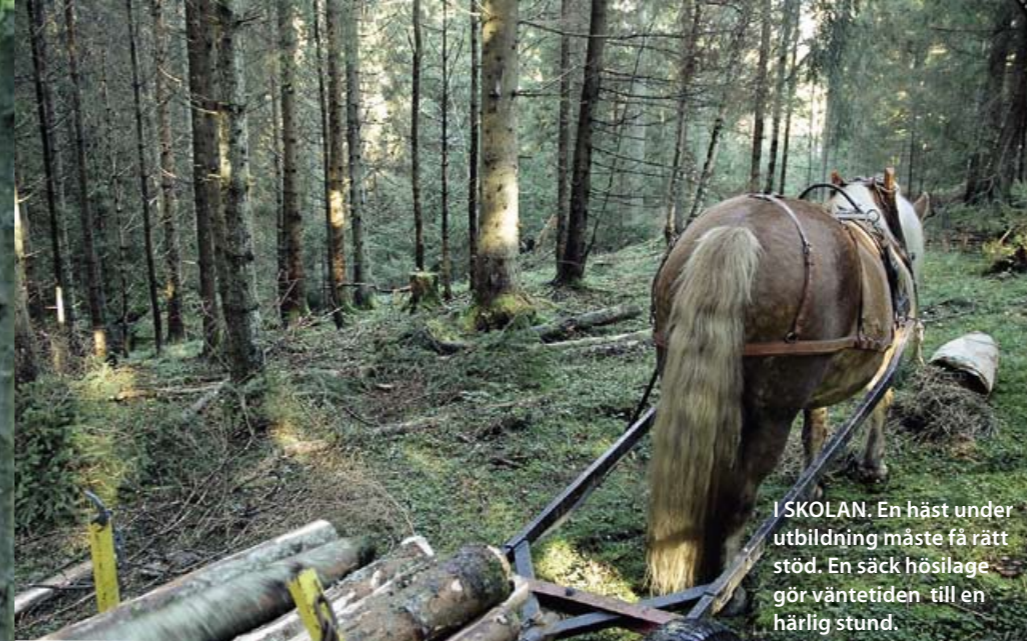
I SKOLAN. En häst under utbildning måste få rätt stöd. En säck hösilage gör väntetiden till en härlig stund.